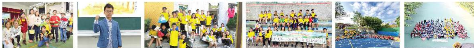
▲英語主題日~未來職業裝扮 ▲演說活動