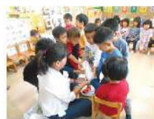
▲ 愛心媽媽的健康課