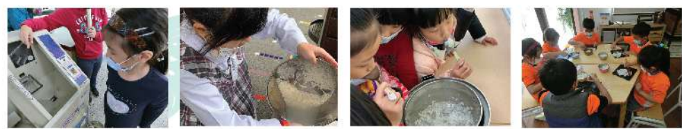
▲動手碾米 ▲學習洗米 ▲動手學煮飯 ▲製作海苔飯捲