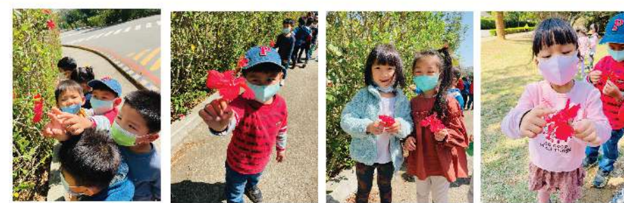
▲我們一起去尋找校園裡的大紅花

有著美麗顏色的花瓣除了欣賞外，我們也可以用花瓣來玩數的遊戲!一朵朱槿有5片花瓣，兩朵朱槿有幾片花瓣呢?大家一起去用朱槿來玩5的倍數的數遊戲吧!