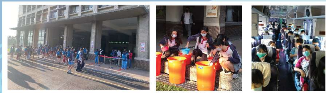
▲ 校門口量測體溫 ▲ 提領漂白水進行教室公共區域消毒工作 ▲ 搭乘校車同學全程配戴口罩

◎註1：每班提供洗手乳，持續宣導飯前、廁後勤洗手。 ◎註2：宣導生病不上學原則。