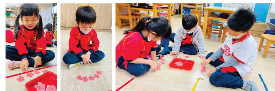
▲花的數遊戲-數數花瓣有幾片?