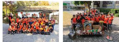
▲創意稻稈春聯 ▲爆米香體驗