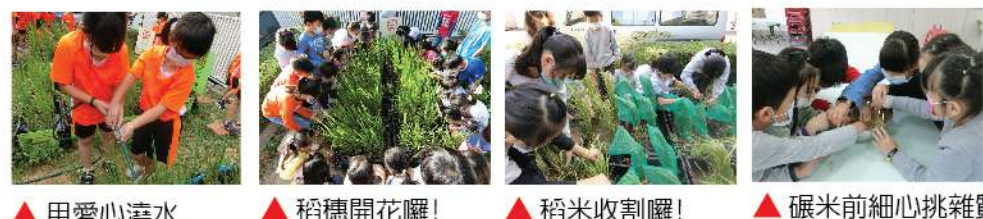
▲用愛心澆水 ▲稻穗開花囉！ ▲稻米收割囉！ ▲碾米前細心挑雜質

這學期一系列和稻米有關的活動，老師們帶著孩子們從插秧、除草、施肥……到等待收割的過程，雖然一點也不輕鬆，但藉此不僅讓孩子們對稻米的生長過程有更多的認識與了解，相信透過種稻的過程，讓孩子們親身體驗農夫耕作的辛苦，對每位孩子來說，更能體驗到米食得來不易，更懂得珍惜啊！