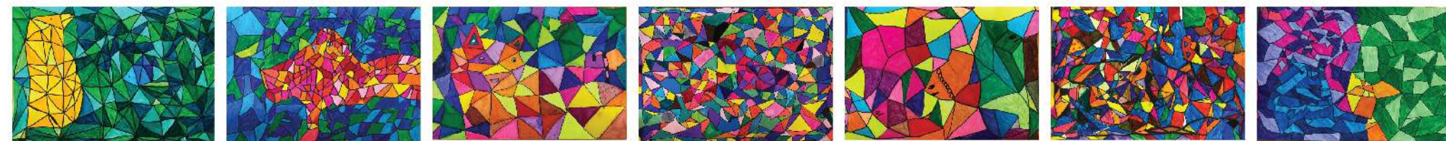
▲翁煊晴 ▲吳承輝 ▲袁若婷 ▲詹煥淇 ▲李牧柔 ▲魯懿霆 ▲黃多莉