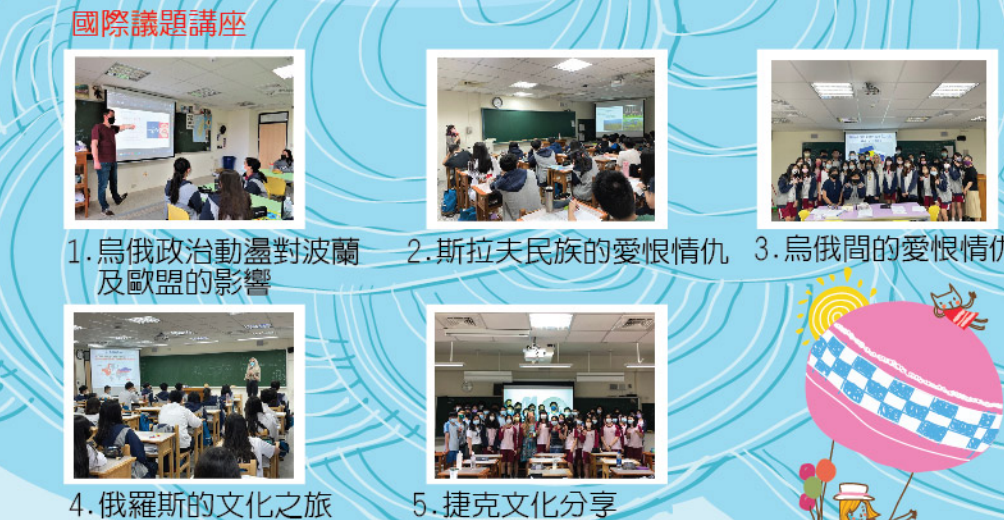
1. 烏俄政治動盪對波蘭及歐盟的影響 2. 斯拉夫民族的愛恨情仇 3. 烏俄間的愛恨情仇 4. 俄羅斯的文化之旅 5. 捷克文化分享

除了舉辦國際議題講座，國際教育處也於3月舉辦東大附中與美國和樂中學線上同步交流，經過3個多月的溝通協調，終於完成第一場同步交流活動，參與學生講以小組的方式，針對學校日程、必修級選修課程、午餐、下課時間在校內的娛樂及好內活動進行交流與討論，感謝東海大學廖敏旬教授極力促成，也謝謝熱情參與的每一位師長及學生，期待下次線上再相會。