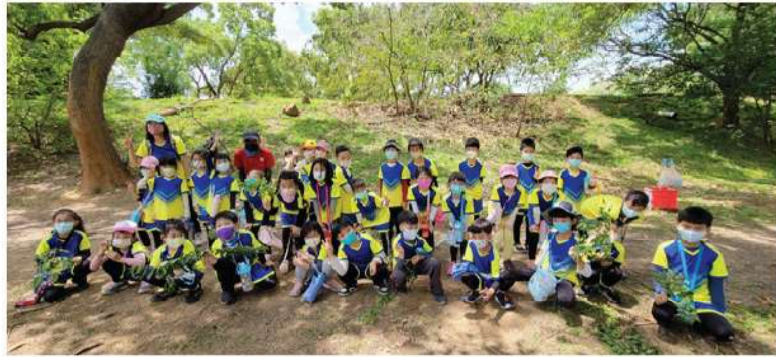
▲ 生態體驗探索成功

東海大學校園是附小孩子們延伸學習的大教室，希望透過「做中學」的實際體驗過程，除了讓學習充滿樂趣，也期待讓孩子們建構出對自然生態的關懷，並且建立環境保護的視野。