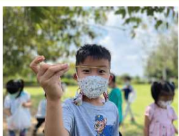
▲ 尋找鳥巢製作媒材-樹葉。

幼兒提出：我們也可以用樹枝、泥土、乾草、衣服的線、鳥羽毛、樹葉、蜘蛛絲...等素材來創作鳥巢啊，接下來的戶外的時間都可以看到幼兒都認真地尋找可以創作鳥巢的素材，更用這些素材創作出自己獨一無二的鳥巢。