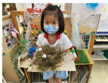
▲ 作品完成-鳥兒築巢真是不容易。