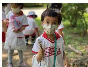
▲ 尋找鳥巢製作媒材-乾草。