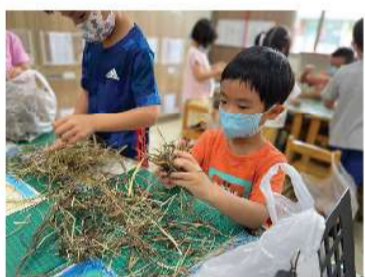
▲ 鳥巢製作-編織高手。