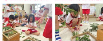
▲每一位孩子如小偵探一樣，仔細比對葉子的葉形