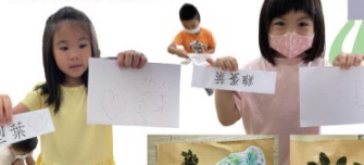
▲能將自己歸納出的葉形製作海報，將所學傳達給他人。